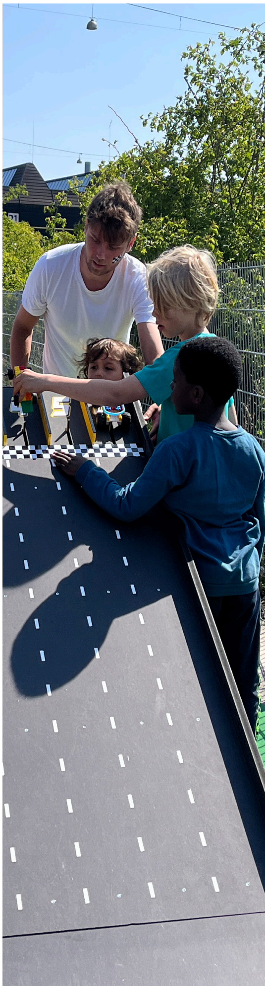
Festival for børns rettigheder 2023

§ 11. Ekstraordinært Årsmøde kan indkaldes, såfremt mindst 3 af Styrelsens medlemmer eller 1/4 af medlemmerne ønsker dette.