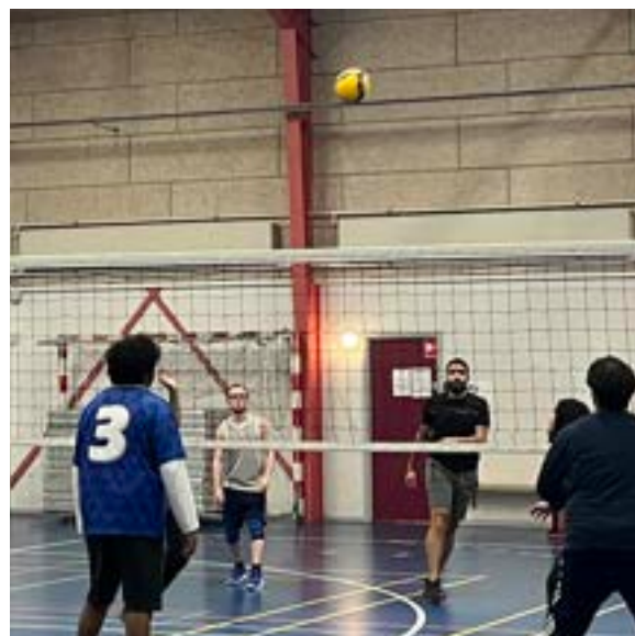
Studietur 3. oktober