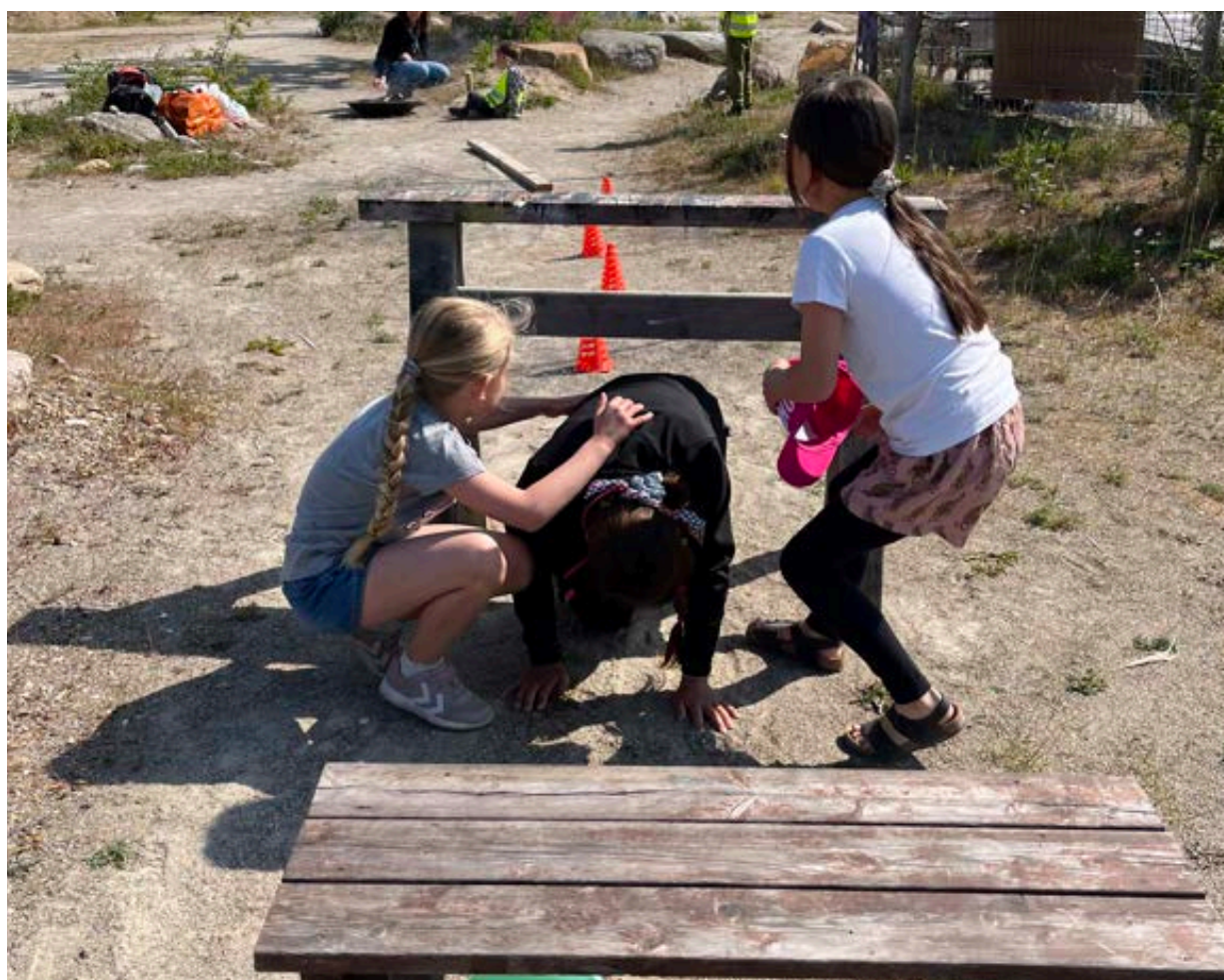
Festival for børns rettigheder 2023

Århus Ungdommens Fællesråd arbejder som paraply for at skabe de bedst mulige vilkår for børne- og ungdomsforeninger i Aarhus. Derudover har ÅUF til formål at servicere medlemsforeningerne og varetage deres interesser samt at understøtte det samfundsengagerende arbejde i børne- og ungdomsforeningerne. En række opgaver går igen fra år til år som en del af ÅUFs faste drift, mens andre planlægges igennem de årlige arbejdsprogrammer.