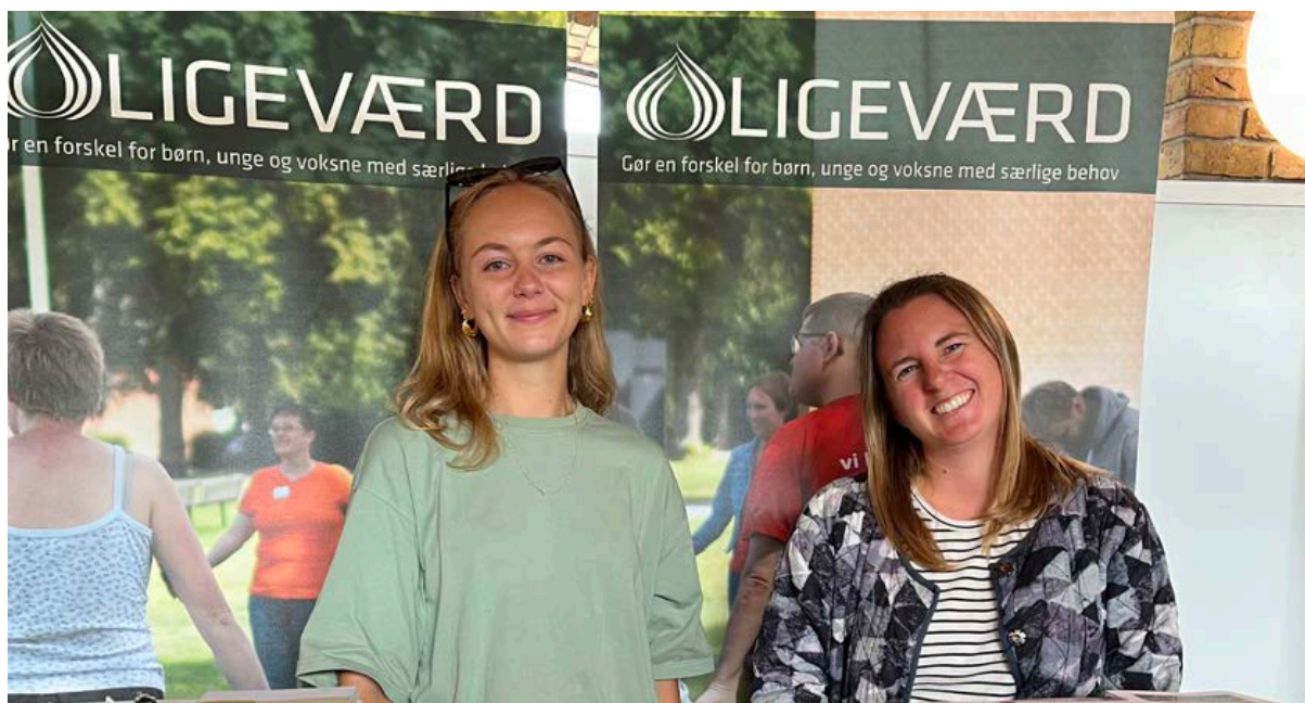
Studiemesse på AU i august

Da ÅUFs nuværende strategi udløber i 2024, er tiden inde til at sætte retningen for de kommende år. Formålet med at arbejde strategisk er at fokusere ÅUFs arbejde, hvor det skaber størst effekt for medlemsforeningerne og for børn og unge i Aarhus. Styrelsen igangsætter en strategiproces, som skal sætte pejlemærkerne for de kommende år - herunder se på mulighed for opdatering af profil og navn. Styrelsen vil involvere medlemsforeningerne, samarbejdspartnere og andre interessenter i processen.