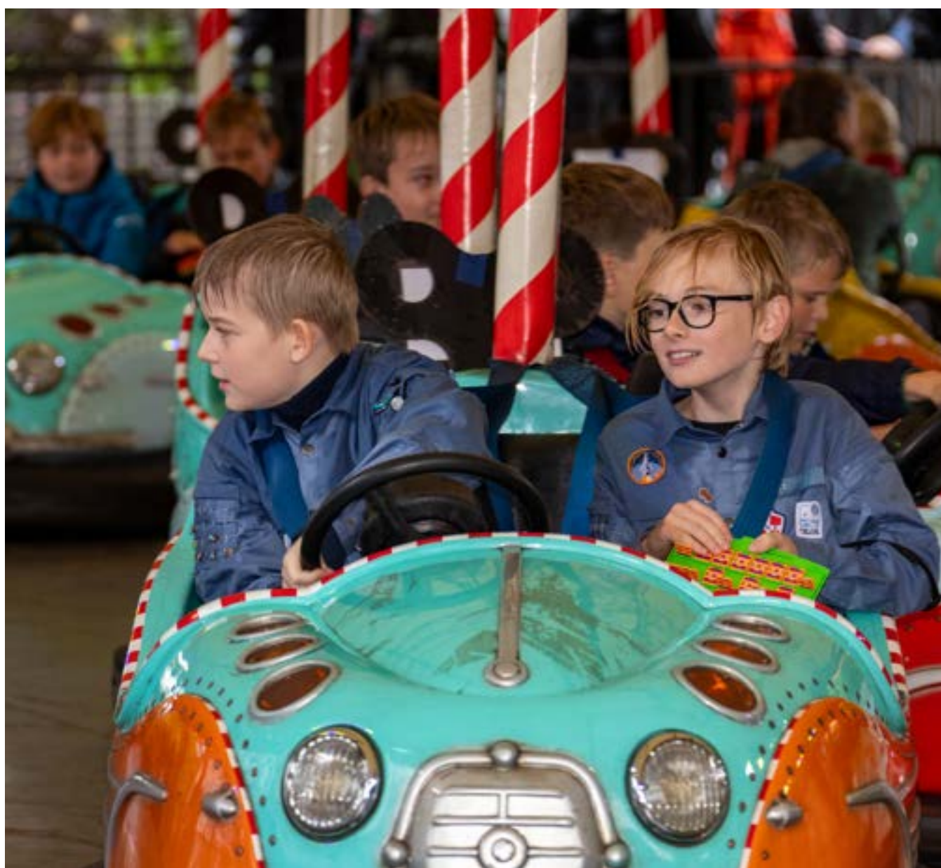
FDF og spejderne i Tivoli