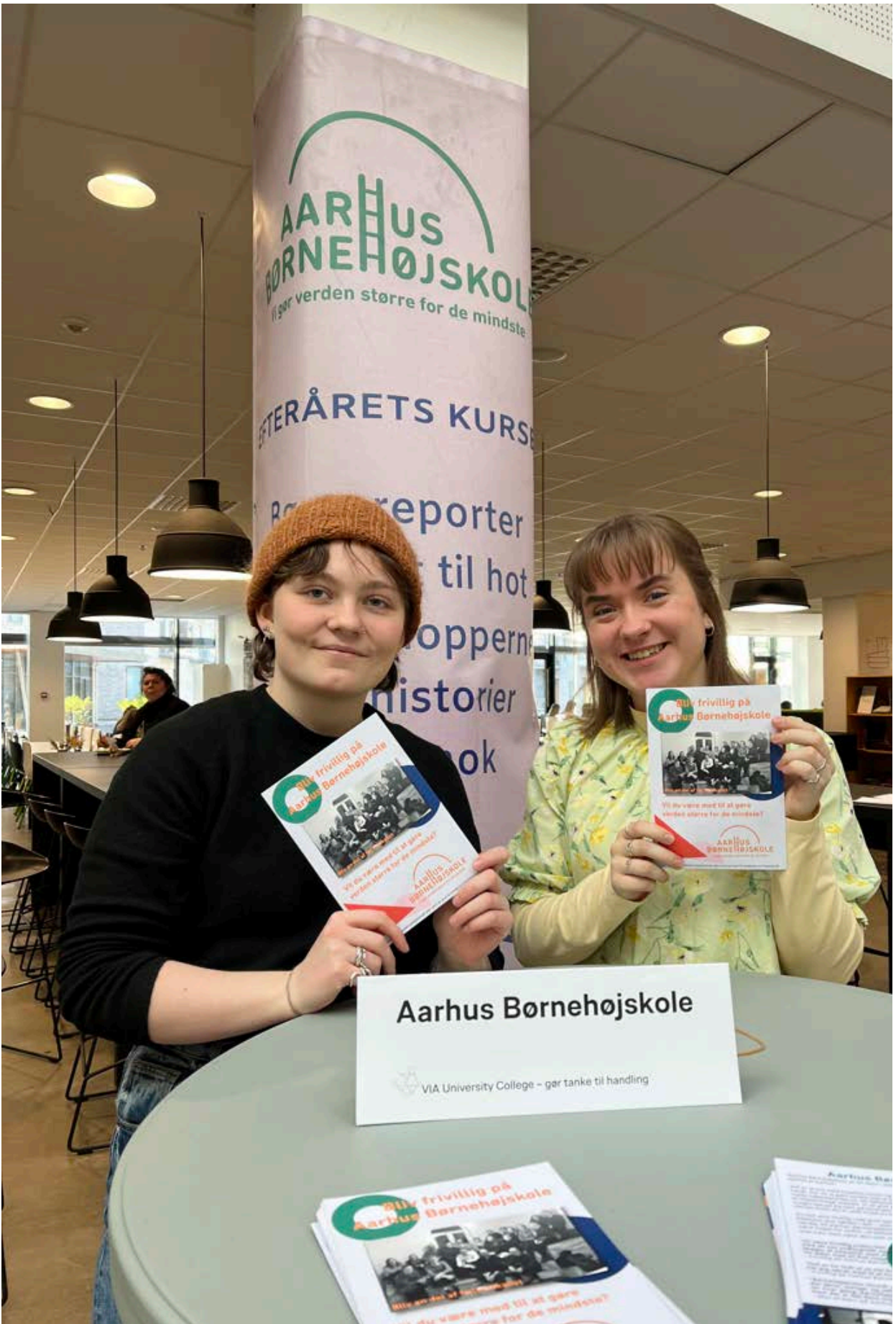
Studiemesse på VIA i marts 2023