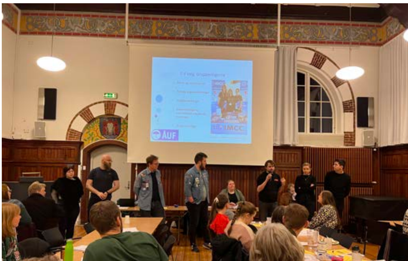
ÅUF årsmøde 2023

§ 20. Nærværende vedtægter, vedtaget på ordinært Årsmøde den 28. februar 2019, træder i kraft straks.