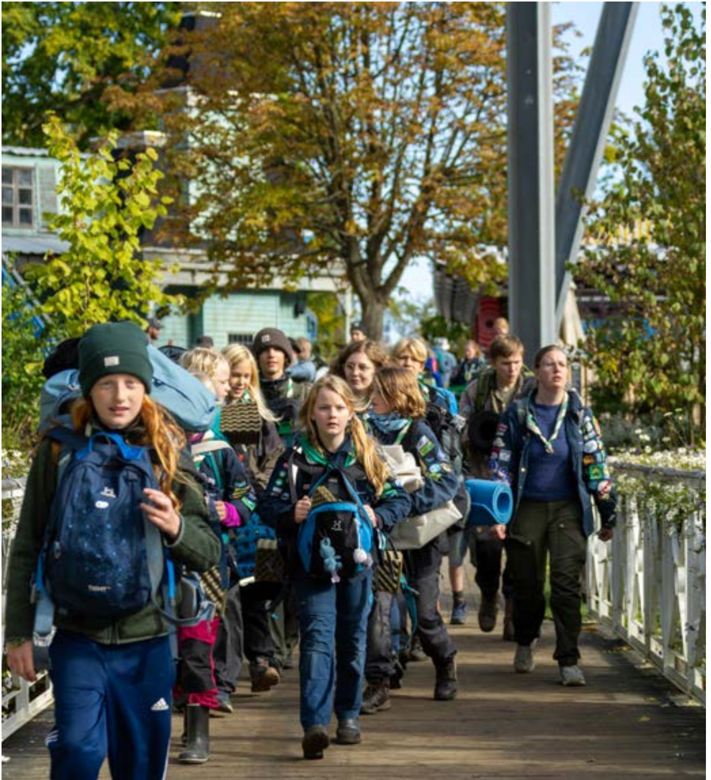
FDF og spejderne i Tivoli