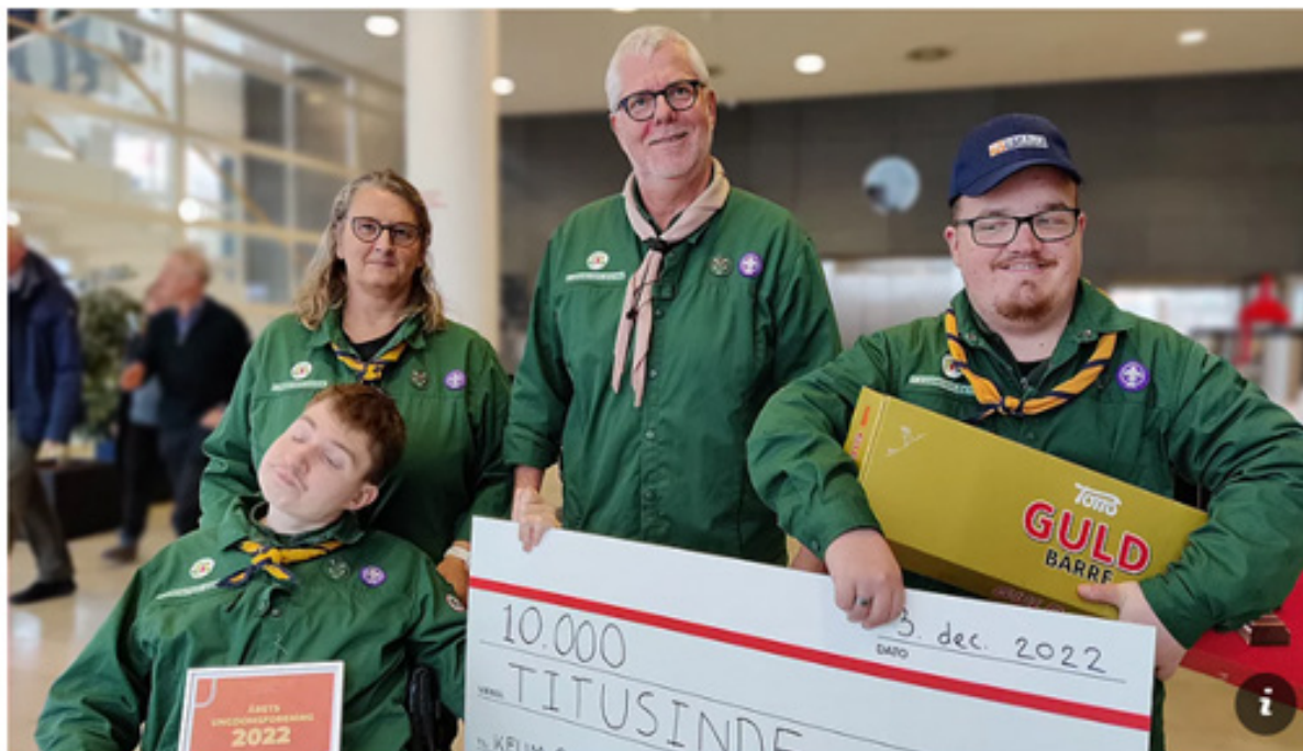
Billedet her er fra TV-syd, hvor Fjordbo-spejderne modtog DUF-pris som årets