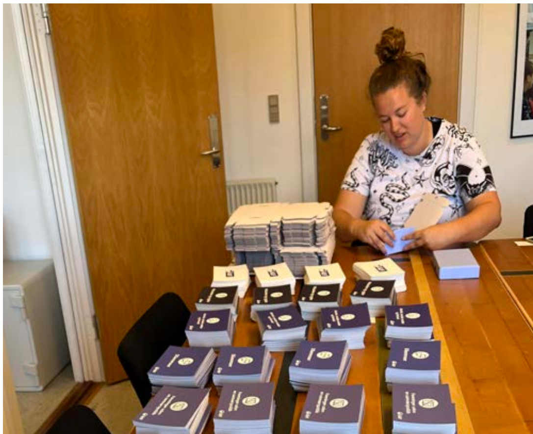
Pakning af dillemaspil på sekretariatet