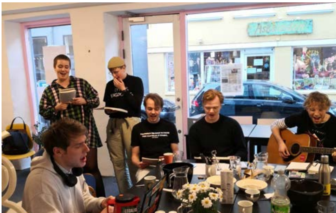
Fællessang i Rød Grøn Ungdom Aarhus