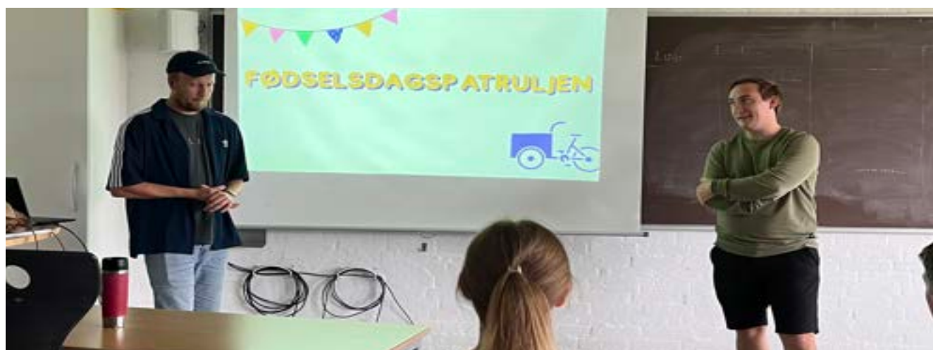
Besøg hos 3K-uddannelsen d. 12 september

Derfor har ÅUF været i dialog med Sport og Fritid i april med ønsker til forbedringer af ordningen, vi har haft et læserbrev i Stiften, og så var der flere partier, som bragte fritidspasset ind i budgetforhandlingerne, dog blev det ikke vedtaget. ÅUF vil fortsætte arbejdet med at sætte spot på fritidspasset.