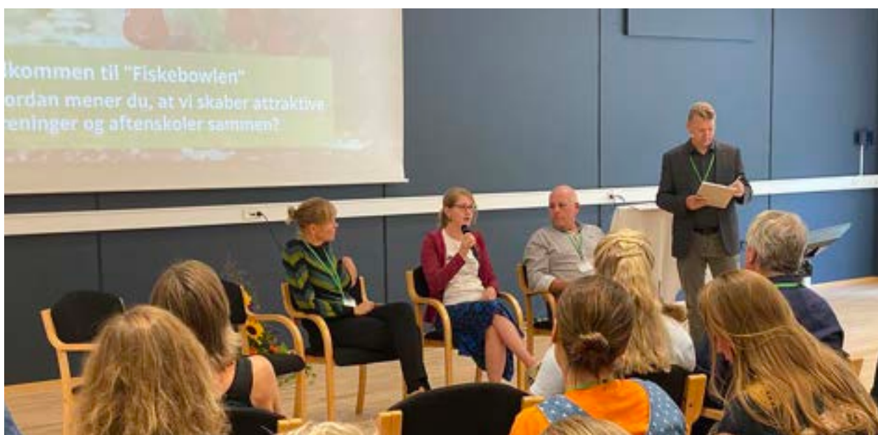
Vifo-konference d. 26.-27. september

ÅUF har i forbindelse med forrige arbejdsprogram arbejdet med at inspirere foreningerne til at invitere flere 'foreningsuvante' børn og unge med i foreningsfællesskaberne. Det vil vi fortsat arbejde på i år, da der stadig er børn og unge, som ikke kender til foreningslivet. Vi vil søge samarbejde med aktører, der arbejder med børn og unge i Aarhus for at bygge bro til foreningerne fra de steder, hvor børn og unge har deres hverdagsliv. Vi vil også fortsat arbejde for at udvide fritidspasset, så der ikke er en økonomisk barriere for at deltage i en foreningsaktivitet.